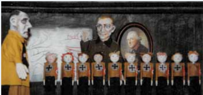
Szenenfotos Poppenspüler-Festival 1999